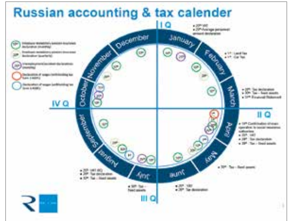
Kirjanpidon ja verotuksen vuosikello kertoo kuukausi-, neljännes- ja vuosi-ilmoitusten aiheet ja ajankohdat Venäjällä.

Ala-Risku sanoo, että Venäjällä liiketoiminnan pitää olla hyvin dokumentoitua ja kaikkea pitää olla tositteet arkistoituina. Helpotusta byrokraatiaan on kuitenkin tuonut se, että nykyään tositteet voi säilyttää sähköisessä muodossa.